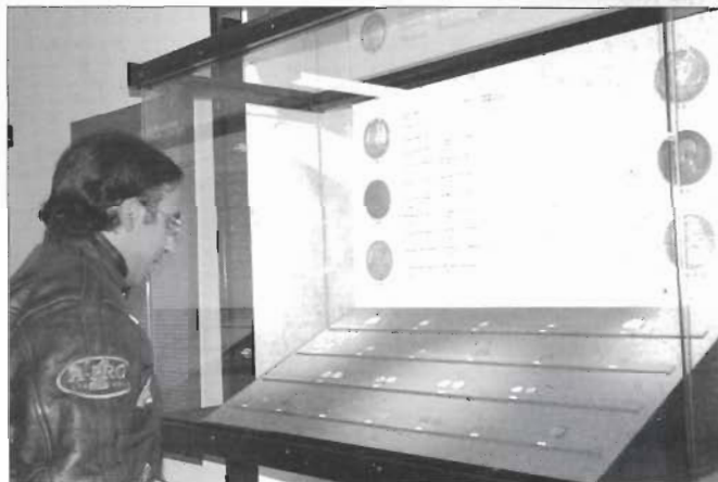
Alcune foto dell'esposizione