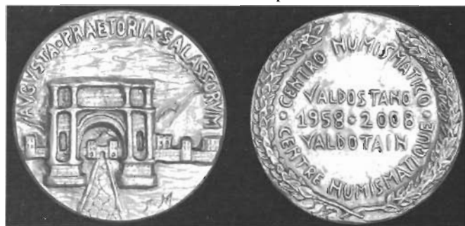
Medaglia del 50° anniversario del Centro Numismatico Valdostano, emesse in bronzo e argento.

Per chi non ha avuto la possibilità di visitare la mostra durante il periodo di apertura, potrà comunque apprezzarla grazie ad una visita virtuale. Infatti, a partire dai primi mesi del 2009, verrà inaugurato un sito che riaprirà ancora per un intero anno l'esposizione. Informazioni possono essere trovate al sito. www.cnvaldostano.it .