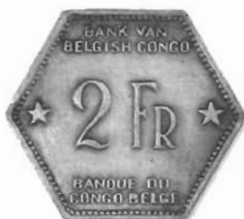
5. Repubblica napoletana (anno VII - 1799) - 6 carlini / 6. Monezzazione Dogale per il Levante, Ludovico Manin (1789) - Tallero / 7. Congo Belga, Leopoldo III (1943) - 2 franchi.