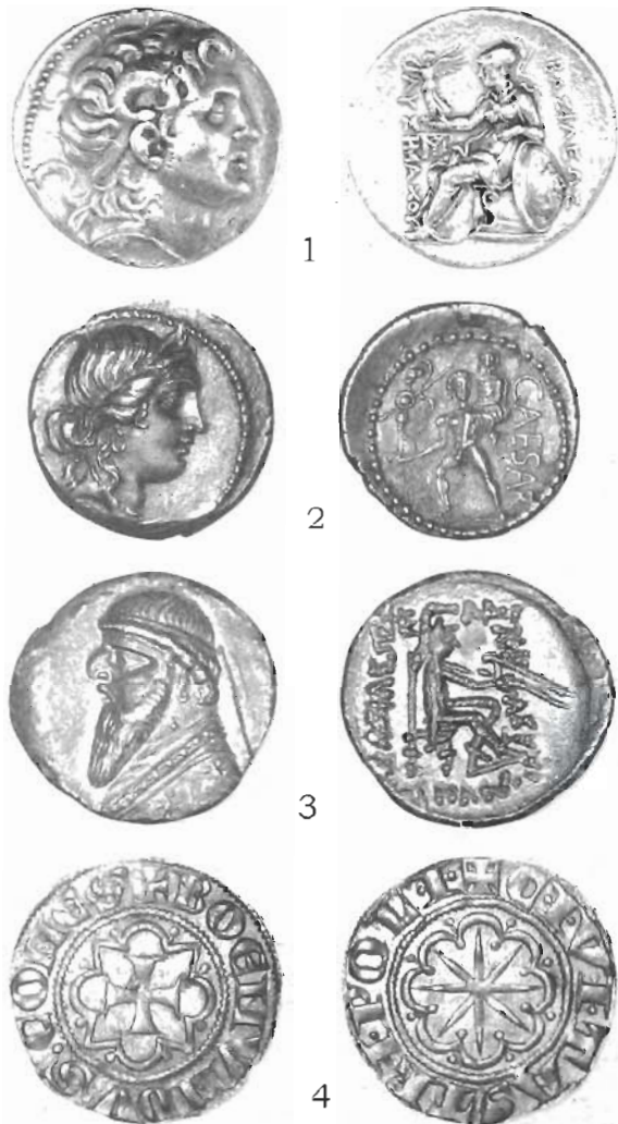
1. Macedonia, Lisimaco (297 - 281 a.C.) - Tetradracma / 2. Giulio Cesare (47 - 46 a.C.) - Denario / 3. Impero partico, Mitridate II (123 - 88 a.C.) - Dracma / 4. Tripoli (Siria), Boemeondo VI (1251 - 1275) - Grosso.

L'esposizione si snodava lungo un percorso che procedeva da Alessandro Magno sino all'imperialismo europeo otto e novecentesco, passando per l'Impero romano, le Crociate e il periodo napoleonico. Attraverso le monete prodotte da culture e popoli dissimili, vissuti sotto differenti forme di stato, è stato possibile illustrare alcuni aspetti concretizzati nella Storia del concetto filosofico di volontà di potenza , nel senso di desiderio o spinta incessante al rinnovamento, al superamento della comune morale e dei limiti posti all'agire umano; una continua tensione e un impulso alla creatività incarnatisi in personaggi storici ed in imperi secolari.